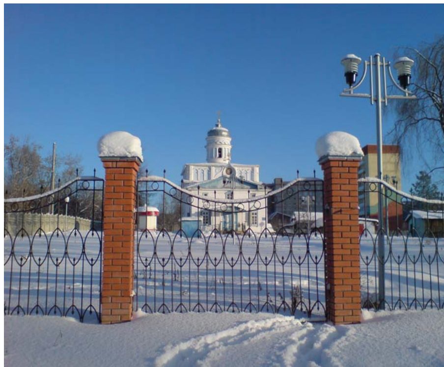
Церковь Иоанна Богослова (1850г.)