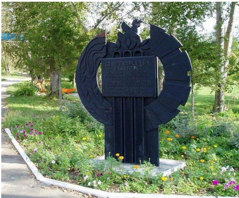
Здесь заложен Детский парк