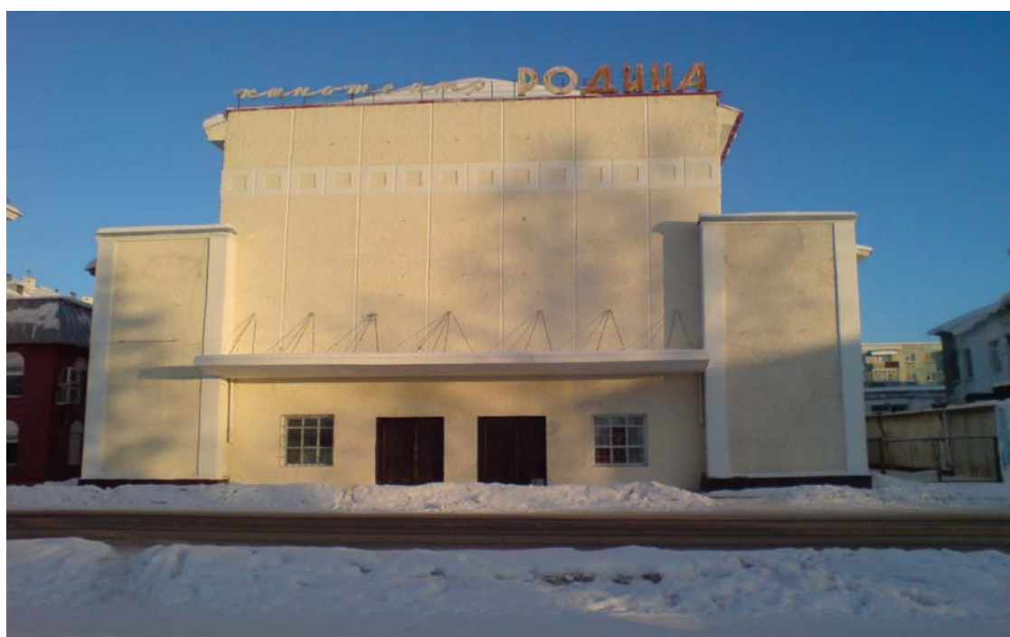
Очевидец истории (1928г.)