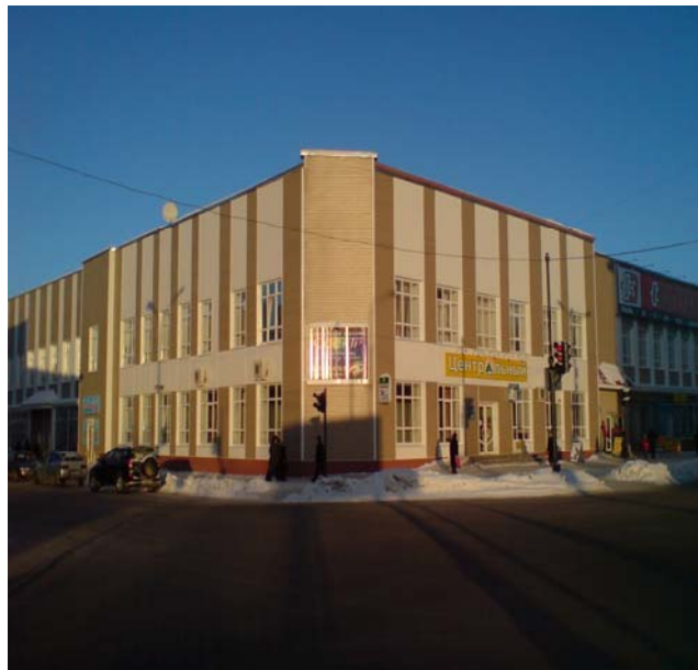
Центральный магазин ( прошлое и настоящее.....)