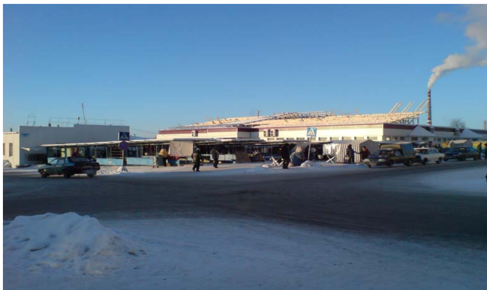
Городской центральный рынок