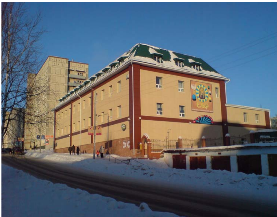
Развлекательный комплекс «Каир» (в советское время - макаронная фабрика)