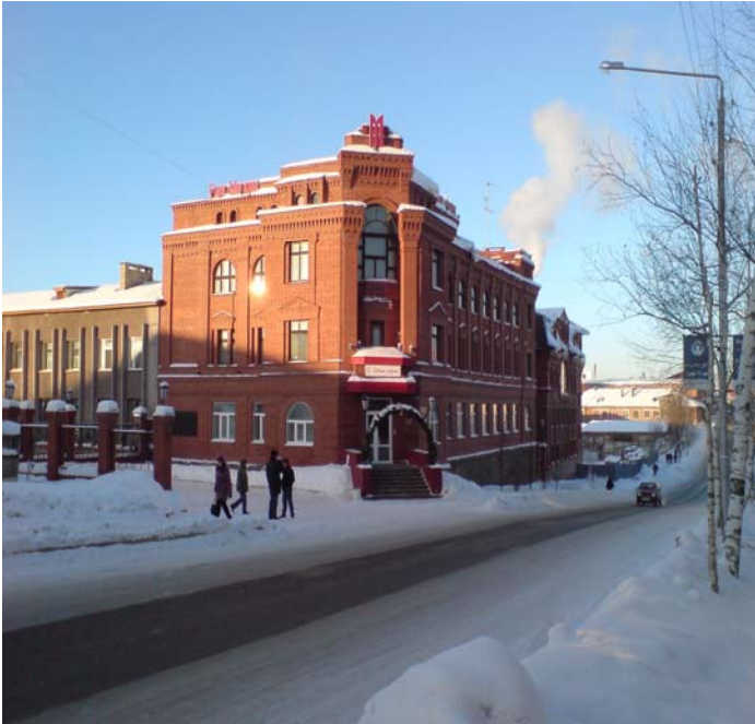
Банк имени Москвы (1997г )