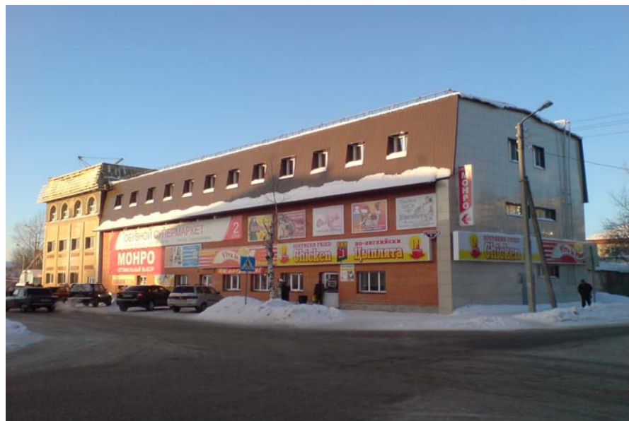
Торговый центр. (До революции магазин готового платья купца Пильникова)