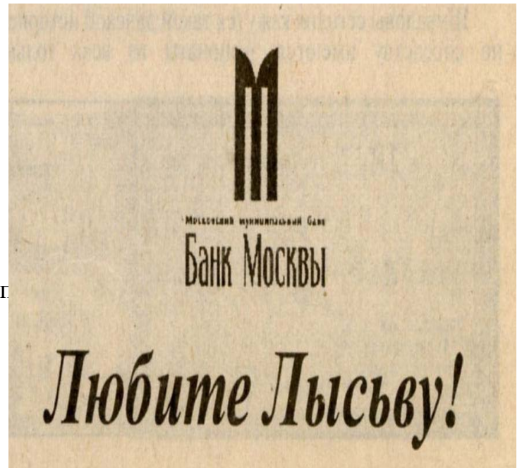
Реклама в газете «Искра»