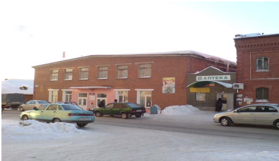
Мини -рынок «Бионт» ( в советские годы - центральная баня )