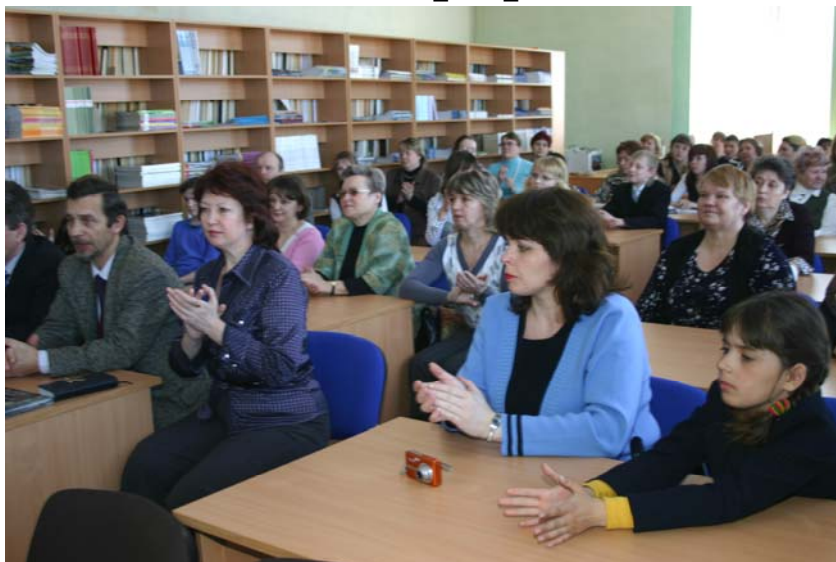
Участники II краеведческого конкурса